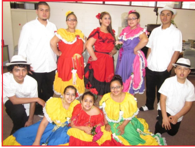
Cinco de Mayo May 14, 2011