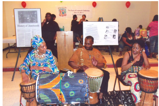
Juneteenth Celebration***June 17, 2011