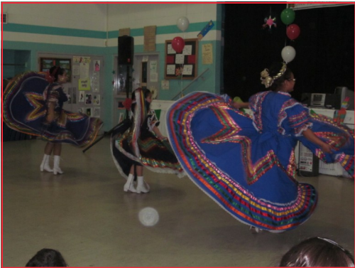
Health Fair May 27, 2011