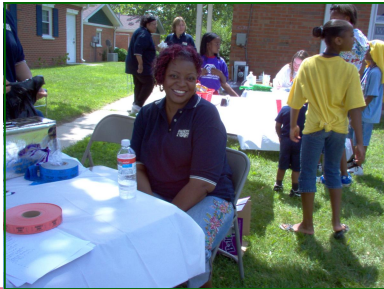
Acontecimiento de Comunidad de Hammond

El 25 de julio de 2008 Healthy Start tuvo su segundo Helado Anual Social en el Centro de Colombia en Hammond. Los participantes de Healthy Start y los miembros de la comunidad se detuvieron brevemente para conseguir la información provechosa y disfrutar del helado y otros bocados deliciosos.